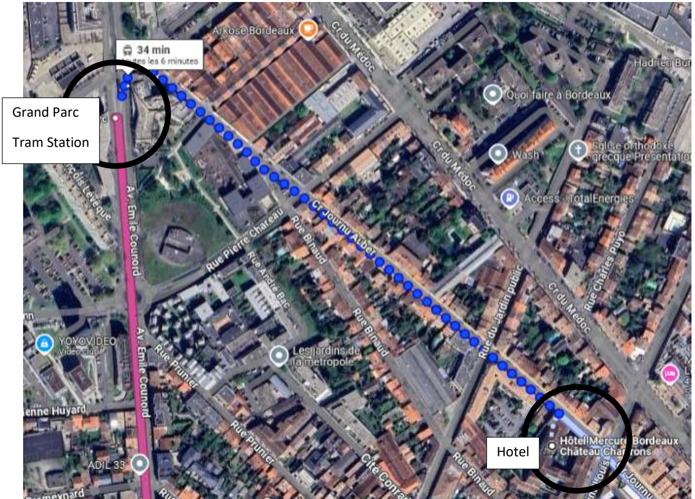
Figure 5: From Tram C to your Hotel

HOTEL MERCURE BORDEAUX CHATEAU CHARTRONS, 81 COURS SAINT LOUIS, 33300 BORDEAUX