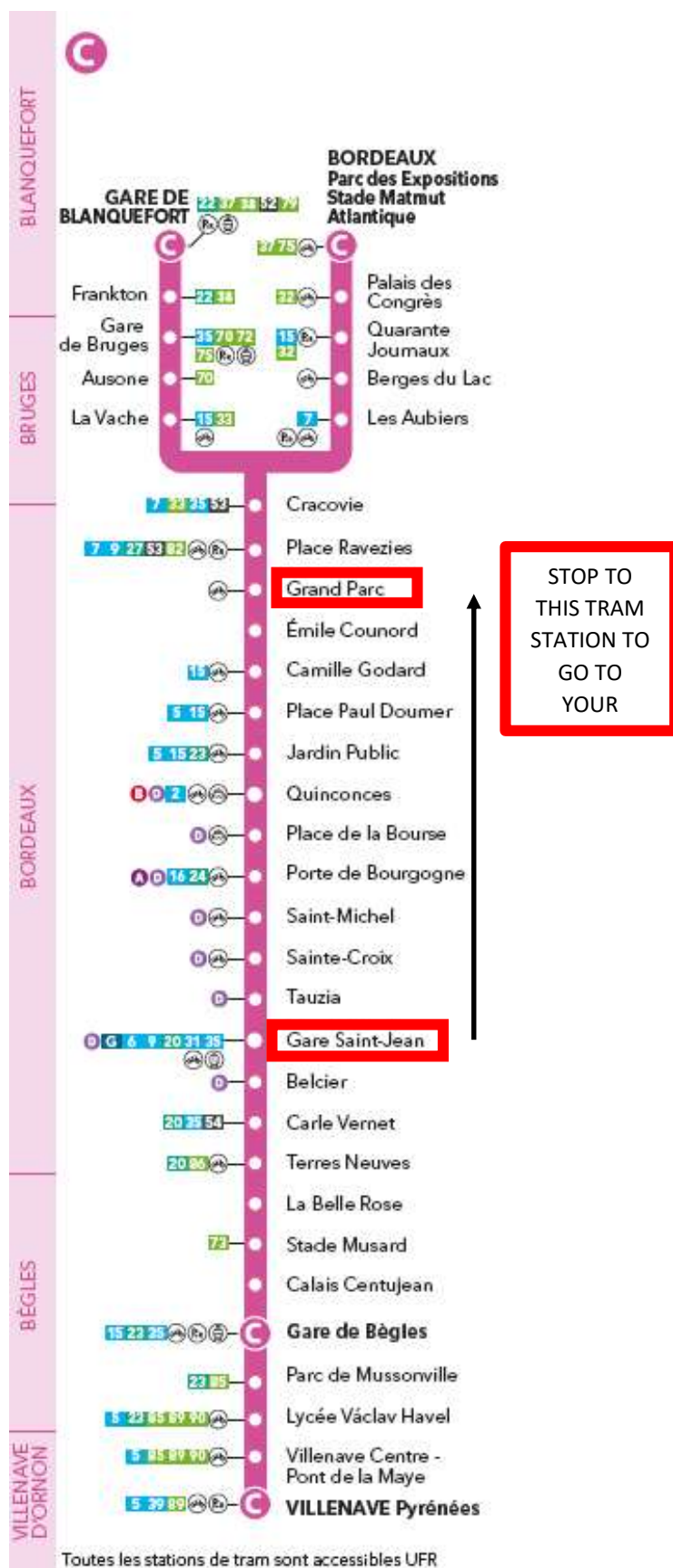
Figure 3: Tramway C Line