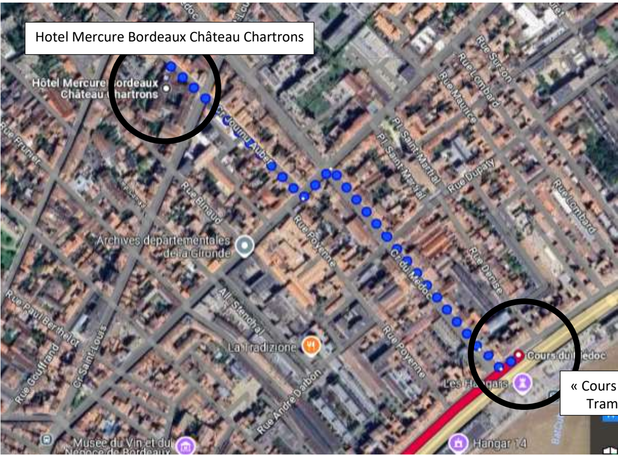
Figure 2: From Tram B to the Hotel