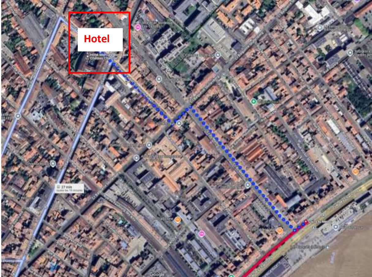
Figure 6: Detailed plan of the hotel area